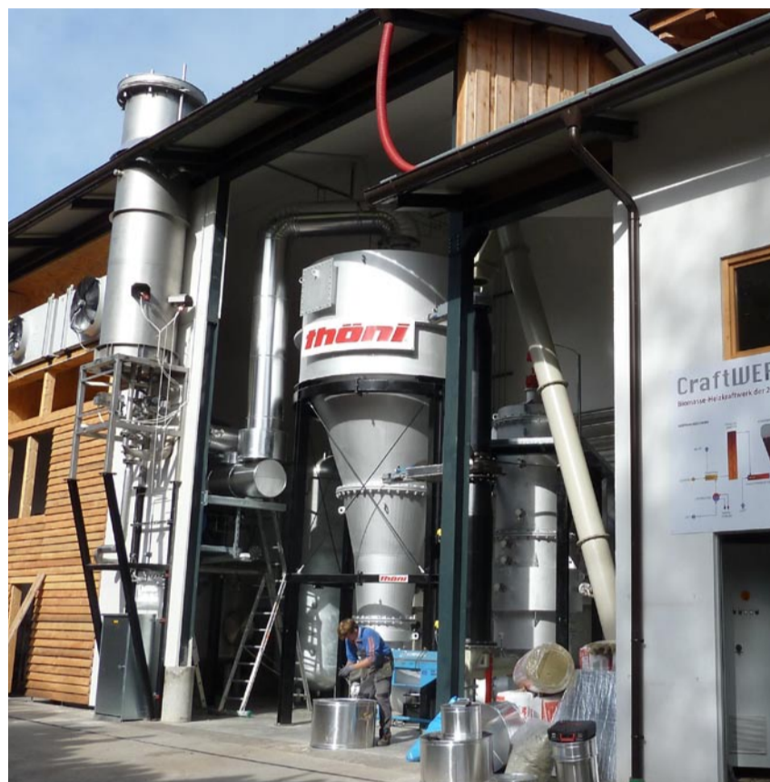
Die Thöni Industriebetriebe GmbH hat das Biomassekraftwerk in Innichen in gerade einmal sechs Monaten Bauzeit errichtet.